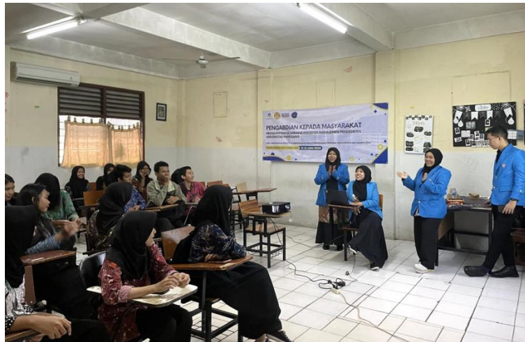
Gambar 1. Organisasi Soft Skill, Presentasi Hasil Proposal

dukungan pada saat proses pelaksanaan PKM. Simulasi ini penting untuk mengetahui tingkat wawasan dan pengetahuan yang diperoleh siswa selama pelaksanaan PKM berlangsung.