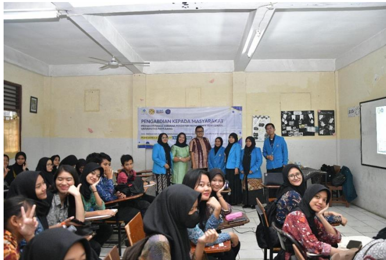
Gambar 1. Foto Bersama Organisasi Soft Skill

mengidentifikasi tantangan yang dihadapi dalam penyampaian materi untuk meningkatkan kemampuan berorganisasi melalui perencanaan proposal yang efektif di SMK Sasmita Jaya 1.